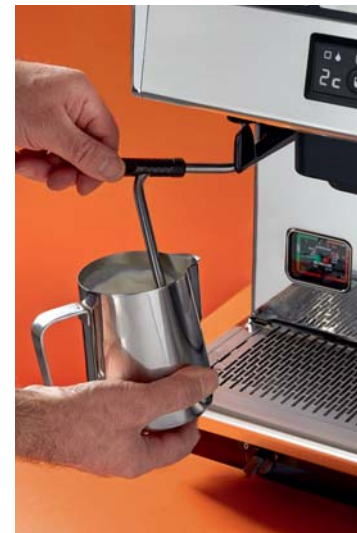
Avec le Steamglide Lever®, le contrôle de la vapeur est opéré manuellement de façon optimale grâce à un robinet rotatif équipé d'une cartouche céramique.