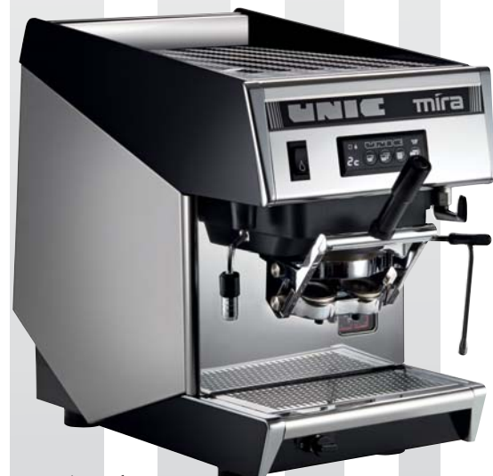
Groupe breveté DCA pour 1 ou 2 dosettes E.S.E.

Café en grains, dosettes, capsules... Choisissez la MIRA qui vous convient ! Grâce au savoir-faire d'UNIC en matière de système d'extraction, il est facile d'adapter sur sa MIRA un système DCA ou DHA à la place du groupe traditionnel. Les systèmes brevetés DCA et DHA permettent ainsi de réaliser 1 ou 2 espresso, à partir de dosettes E.S.E. et de capsules sur une machine comme la MIRA, offrant en parallèle tous les avantages d'un matériel dédié à une utilisation professionnelle.