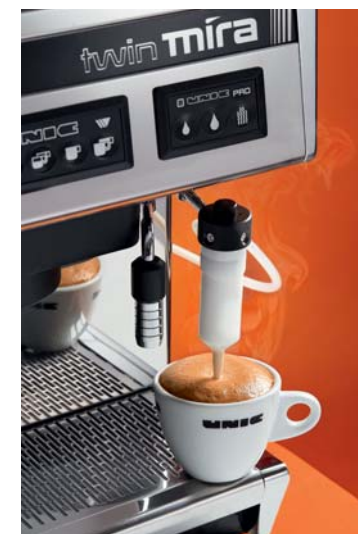
Le système LC s'adapte facilement à la place de la sortie vapeur standard en inox : deux fonctions possibles Latte pour chauffer le lait / Cappuccino pour émulsionner le lait.