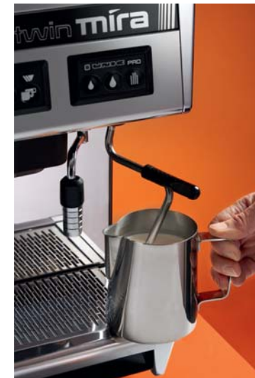
Une seconde sortie vapeur programmable est pilotée depuis le boîtier dédié. Le contrôle temporisé de la vapeur facilite le travail du barista au quotidien.