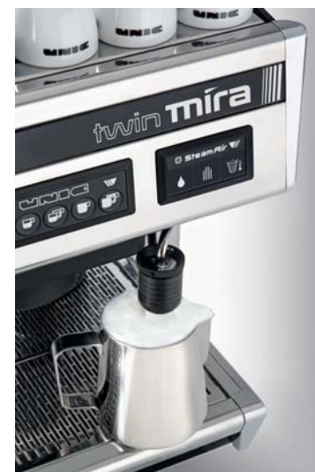
Avec le système exclusif STEAMAIR®, la préparation d'une mousse de lait fine, lisse et onctueuse est à la portée de tout utilisateur. Equipée d'une sonde thermique, la sortie STEAMAIR® en Teflon, facile à nettoyer, s'arrête automatiquement une fois la température programmée atteinte.