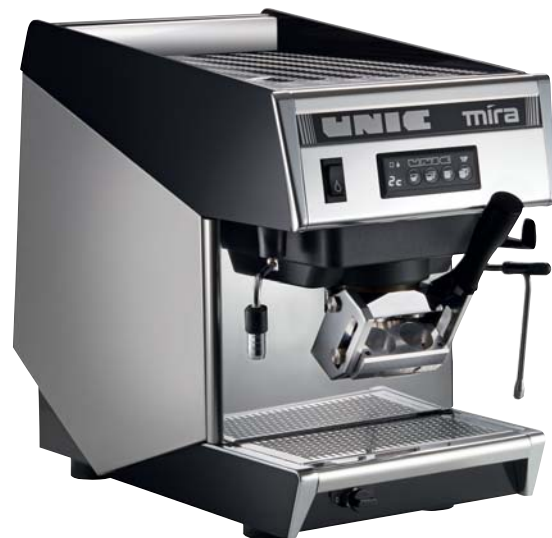
Avec un groupe breveté DHA pour 1 ou 2 capsules